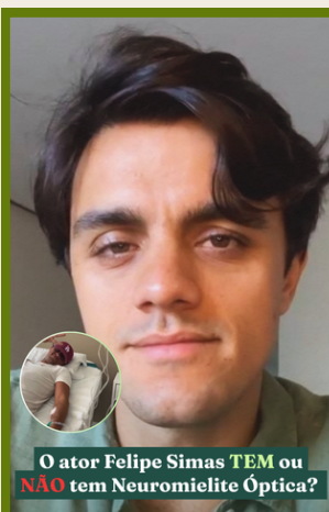
O ator Felipe Simas TEM ou NÃO tem Neuromielite Óptica?

O ator Felipe Simas publicou um vídeo sobre a Neuromielite Óptica pelo próprio perfil no Instagram, no dia 22 de junho. Esse conteúdo se tratou de uma campanha patrocinada em prol da conscientização sobre a doença, não de um relato pessoal de diagnóstico.